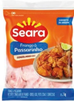
Frango a Passarinho Congelado Seara Pacote 1kg