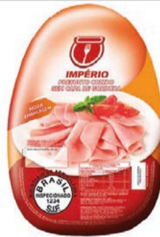
Presunto Império Peça/ Peçaço kg