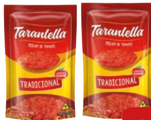
Molho de Tomate Tradicional Tarantella Sachê 300g