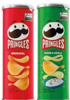
Batata Pringles Sabores 104g/ 105g/ 109g