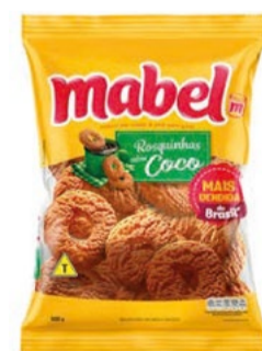
Rosquinhas de Coco Mabel 500g