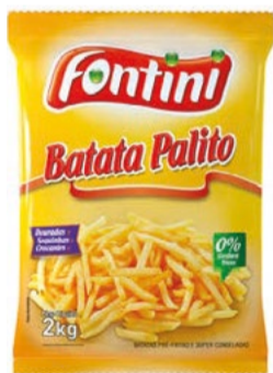
Batata Congelada Fontini 2kg