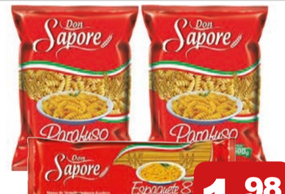
Massa Sêmola Don Sapore 500g (Exceto Ninho)