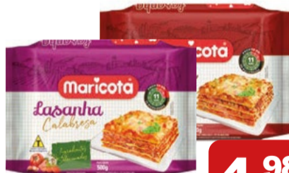
Lasanha Maricota Sabores 500g