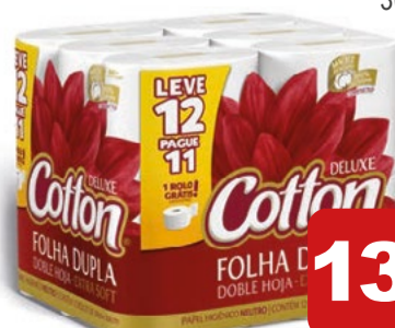
Papel Higiênico Cotton Folha Dupla 30 metros Leve 12 Pague 11