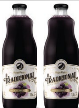
Suco de Uva Integral Tradicional Hugo Pietro 1,5 litro