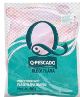
Filé de Tilápia Congelada Q-Pescado 400g