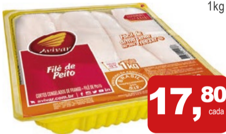
Filé de Peito de Frango Congelado Avivar Bandeja 1kg