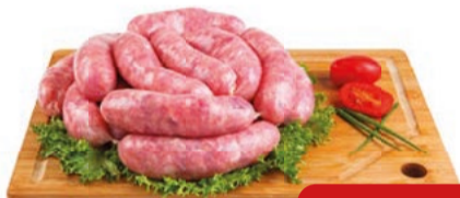
Linguiça em Gomos p/ Churrasco Perdígão kg