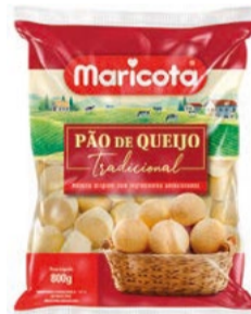
Pão de Queijo Tradicional Maricota 800g