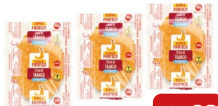
Steak de Frango Congelado Super Frango 100g