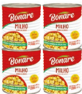
Milho Verde Bonare 170g