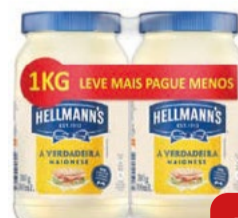
Maionese Tradicional Hellmann's 500g c/ 2 Leve Mais Pague Menos