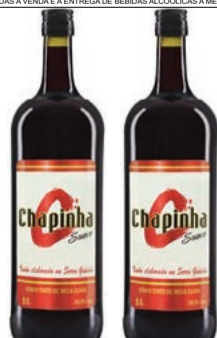
Vinho Tinto Suave Chapinha 1 litro