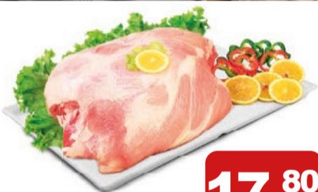
Pernil Suíno Resfriado s/ Osso Peça/ Peçaço kg