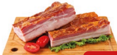
Bacon Manta Perdígão Peça/ Peçaço kg